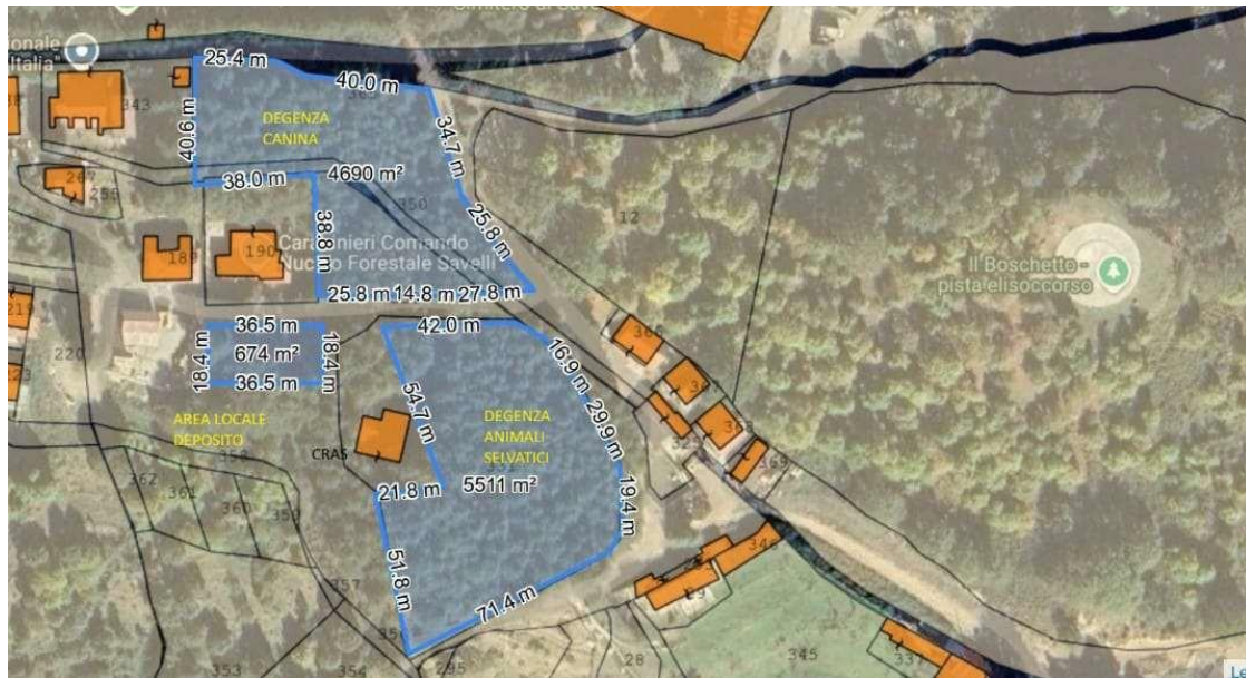
Foto 9 – planimetria

La viabilità presente è tutta comunale ed asfaltata. Oltre alle due Caserme Forestali (Comando Provinciale e Reparco Carabinieri PN Sila – Mezzocampo ) sono presenti locali comunali e a 200 metri la pista elisoccorso finanziata dall'Ente Parco.