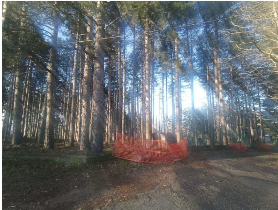
Foto 6: area degenza animali selvatici (già recintata) in comodato d'uso gratuito all'Ente Parco

Sarà necessario anche prevedere un impianto di illuminazione esterna ed idrico per garantire la pulizia dei ricoveri.