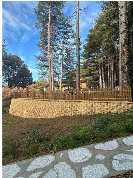
Foto 4 e 5 Esterno C.R.A.S.